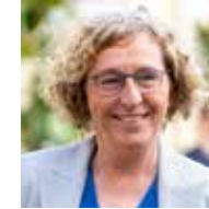
Muriel Pénicaud Ministre du travail