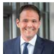
Cédric O Secrétaire d'État auprès du ministre de l'Économie et des Finances et du ministre de l'Action et des Comptes publics - Chargé du Numérique.