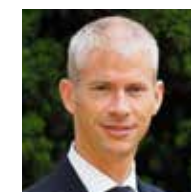
Franck Riester Ministre de la Culture