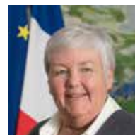
Jacqueline Gourault Ministre de la Cohésion des territoires et des Relations avec les collectivités territoriales