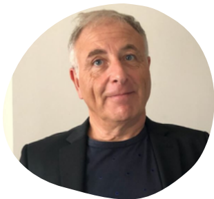
Laurent Terrisse Agence Limite